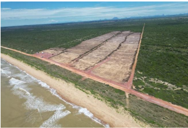
Figura 3. Área com vegetação suprimida na Restinga de Praia das Neves - ES, para implantação do Porto Central.

O caso mais recente e emblemático ocorreu no município de Presidente Kennedy, extremo sul do Espírito Santo (Braz et al., 2013). A Restinga de Praia das Neves, um dos últimos trechos de Restinga bem preservados do Sudeste, teve sua vegetação parcialmente suprimida, com autorização de órgãos governamentais, para a instalação de um complexo logístico-industrial na região, denominado de Porto Central, concebido como um “hub” multimodal de relevância nacional, com conexões projetadas para a BR-101 e para futuros ramais ferroviários (Porto Central, 2025). Os impactos diretos e indiretos desse empreendimento, contudo, é devastadoras, tendo como resultado a destruição quase completa dos habitats da Restinga em Praia das Neves (Figuras 2 e 3).